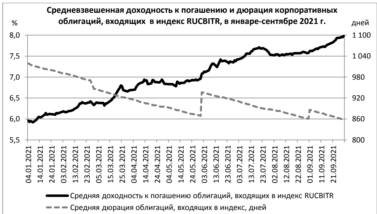
Рисунок 3. Средняя доходность к погашению и дюрация облигаций, входящих в индекс RUCBITR

Доходность к погашению облигаций, входящих в индекс RUCBITR, в сентябре 2021 г. изменялась в пределах от 7,62% до 7,98% (Рис. 3), тогда как в августе 2021 г. фиксировалась доходность от 7,51% до 7,60%. Дюрация облигаций в составе индекса снизилась за сентябрь 2021 г. с 886 до 858 дней.